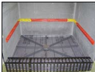
Roughly align StringA-Level