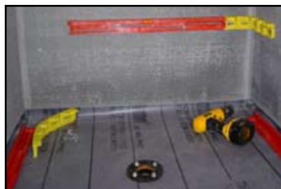
Secure StringA-Level sections to wall