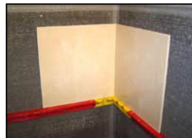
Set tile on top of StringA-Level

Designed primarily for shower wall tile installations, the StringA-Level™ Tile Support System is for use on any wall mounted tile installation where tiling begins above the floor. The system is a set of reusable tools that eliminate time wasting straightness and level problems with wood stringers. The system is comprised of interlocking sections with level vials that are used in series to form a continuous angle support shelf on which the first course of tile rests. The sections are temporarily attached to the wall with user supplied screws and washers through multiple slots in each section. Available in kit and component form with illustrated usage instructions.